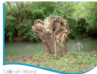
Taille en têtard d'un saule