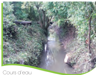
Cours d'eau entretenu en 2016 à Cormery